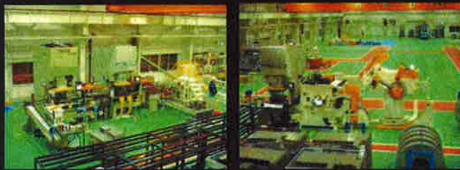
住宅部材専用ライン